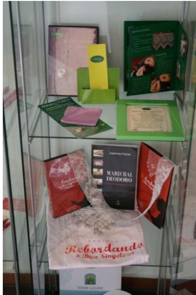
Imagens 14 a,b; (a) - Vitrine dupla no Museu do Termalismo em Latronico com peças do Puntino ad Ago - Latronico- Itália e da Singeleza – Alagoas – Brasil, ainda mantida em agosto de 2013.