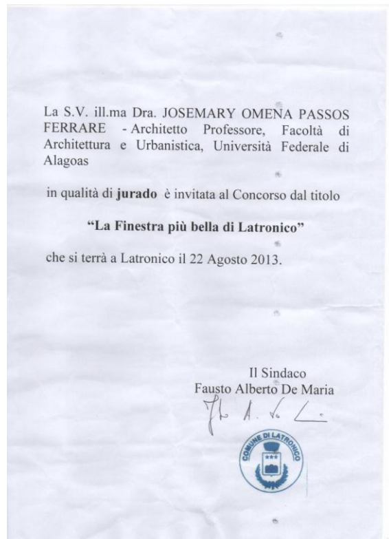
Imagem 02: Convite oficial para a participação no 'Júri Técnico de Qualidade' formulado / enviado pelo Síndaco de Latronico aos respectivos integrantes. (Enviado por e-mail pela Associação Il Tassello).