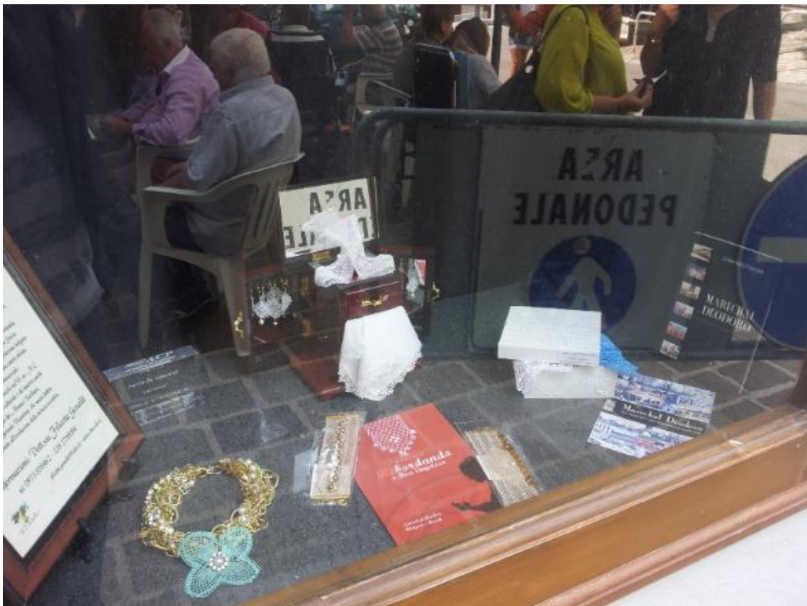
Imagem 11: Fotografia da “Vitrine da IL TASSELLO” montada no dia posterior ao Concurso, expondo parte das peças em Singeleza de Alagoas que foi doada pelo Projeto (Re)bordando e passaram a compor a vitrine do trimestre julho-agosto-setembro / 2013. Destaca-se em primeiro plano o colar com pingente em rosácea verde em Singeleza e dois braceletes na cor bege costumizados Foto: Elzio Ferrare, Latronico, agosto 2013.

Essas peças levadas e entregues este ano passaram a compor a Vitrine da Associação IL TASSELLO que sempre mantém esta vitrine com exposições específicas com peças em Puntino ad Ago (e desde julho de 2012) também com peças em Singeleza de Alagoas – Brasil, objetivando dar a conhecer à população local e visitante, a extrema similaridade das duas rendas. Tal ocorrência encanta aos que visualizam as exposições mantidas na “Vitrine da Il Tassello” como é chamada esta ‘janela de novidades’. A vitrine é sempre recomposta trimestralmente e se constitui uma atração na localidade.