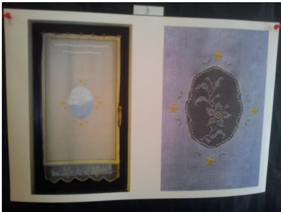
Imagem 06: Fotografia (com detalhe) do exemplar de cortina N. 3 participante do Concurso “La finestra piú bella de Latronico” em exibição na sede da Associação Cultural IL TASSELLO para análise dos cidadãos e jurados. Foto: Elzio Ferrare, Latronico, agosto 2013.