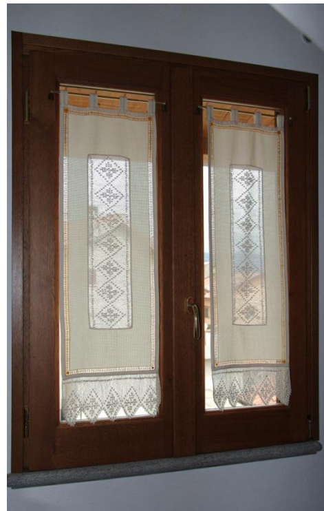
Imagem 05 a, b : Exemplos de cortina participante do Concurso “La finestra piú bella de Latronico” (a) – Vista do lado externo; (b)- Vista do lado interno das respectivas edificações. Foto: Elzio Ferrare, Latronico, agosto 2013.