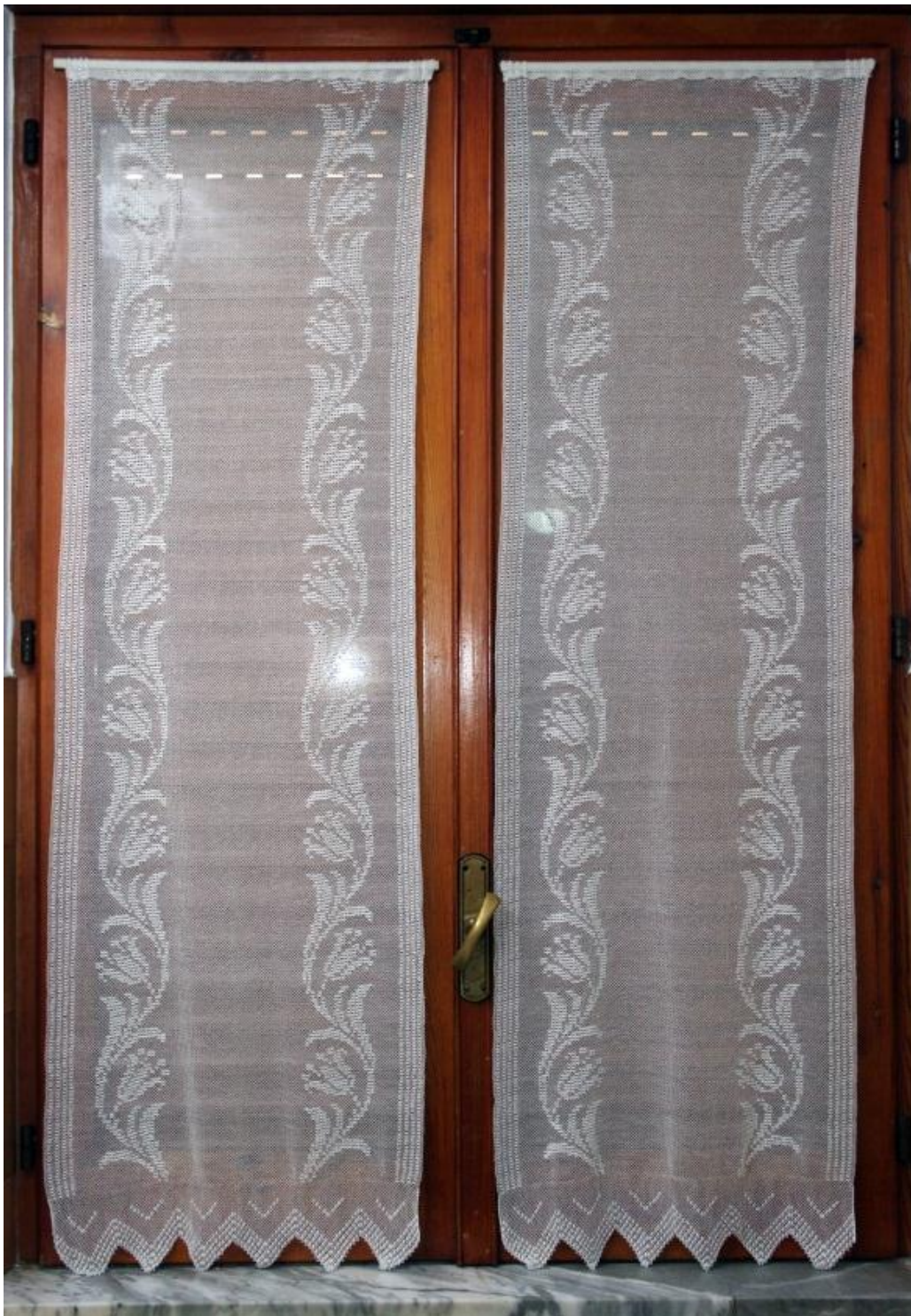
Imagem 07: Fotografia do exemplar de cortina eleito como o segundo colocado no Concurso “La finestra piú bella de Latronico” vista do interior da residência. Confeccionada pela senhora Ana Gigante. Latronico, agosto 2013.