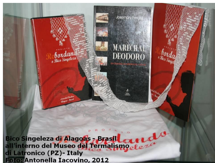
(b) - Detalhe da vitrine onde estão expostas a peça em Renda Singeleza, camiseta, folder e vídeo do Projeto (Re)bordando o Bico Singeleza; e ainda livro sobre a cidade Marechal Deodoro, em exposição continuada, desde agosto de 2012.