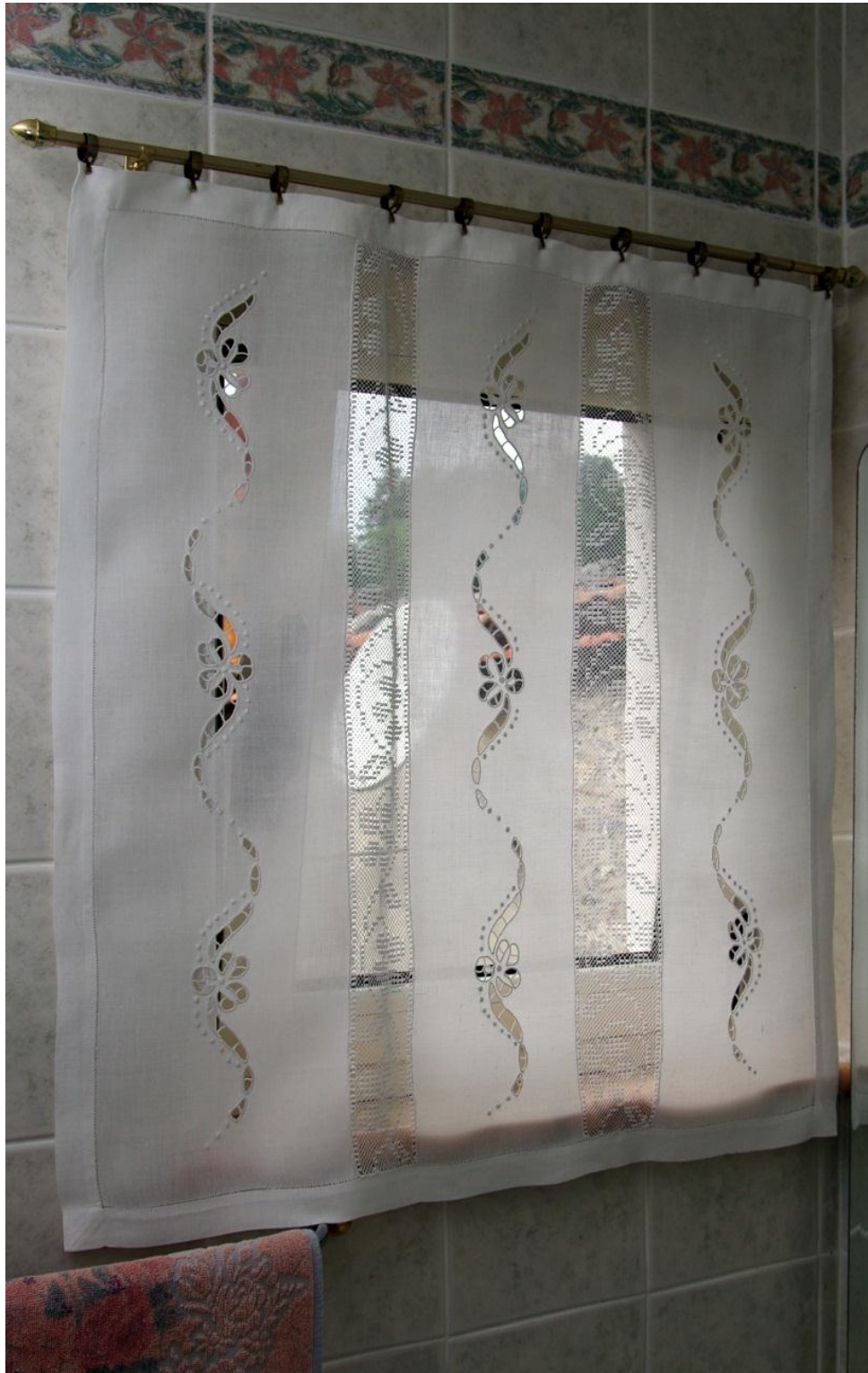
Imagem 08: Fotografia do exemplar de cortina eleito como o primeiro colocado no Concurso “La finestra piú bella de Latronico” vista do interior da residência.