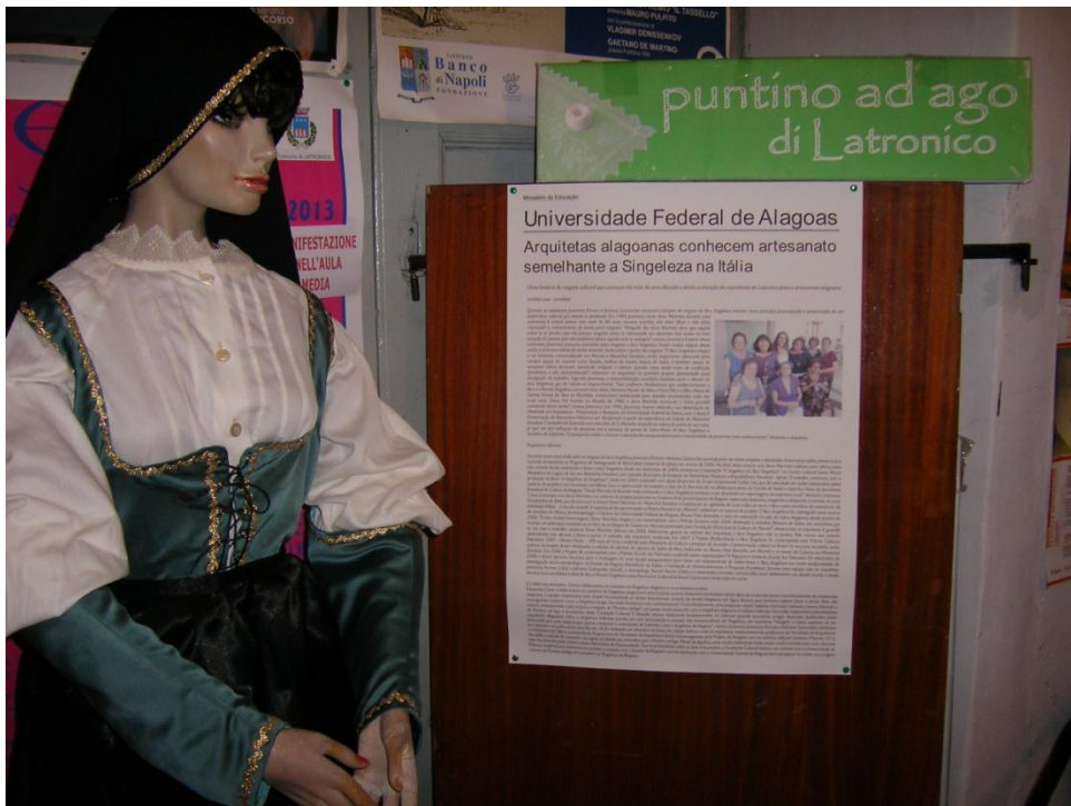
Imagem 10: Fotografia do banner com a matéria publicada no site UFAL/agosto/2012, ampliada e exposta na sede da Associação Cultural IL TASSELLO. Vale observar o manequim que expõe o traje típico da localidade Latronico, com o uso de bico confeccionado em Puntino ad Ago na gola da vestimenta tradicional.

O cavalete com o banner se encontra na sala principal da Associação IL TASSELLO, instituição cultural que é diariamente aberta ao público para visitação e realização de cursos.